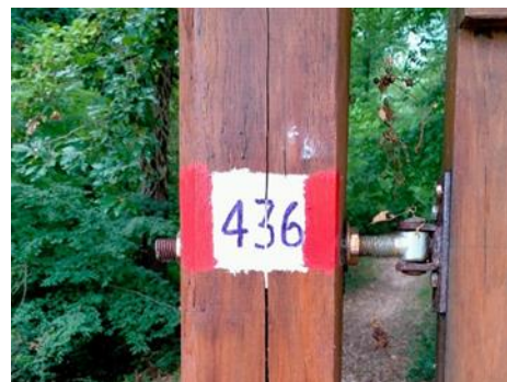
Segnavia a bandierina - Segnaletica orizzontale

vengono eseguite attività volte a liberare la sede del sentiero da foglie, rami secchi, sassi, rovi e via dicendo. Tutte attività, quindi, che possono essere effettuate con l'ausilio anche di semplici attrezzi da giardinaggio come rastrello, cesoie per rami, forbici da potatura.