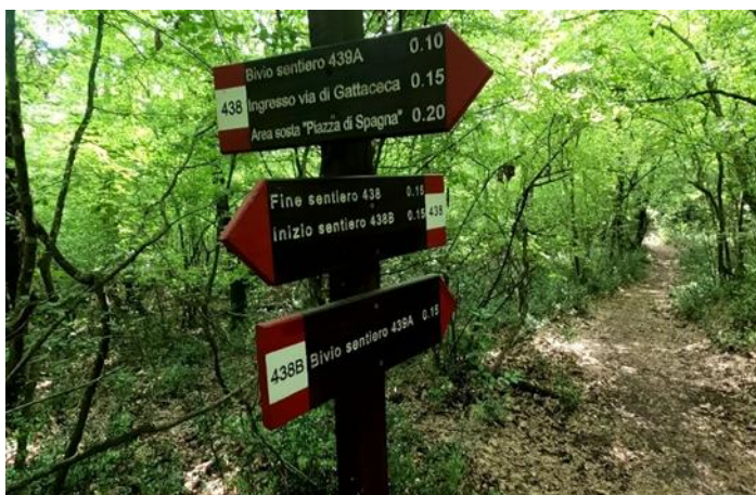
Tabella segnavia - Segnaletica verticale

Per entrare nel Gruppo Sentieri non sono richieste competenze particolari e ognuno può trovare le attività a lui più adatte.