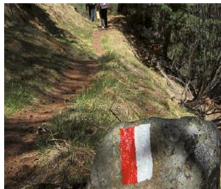
Segnavia di continuità - Segnaletica orizzontale